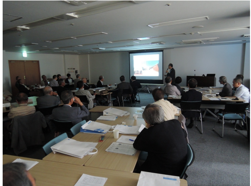
府大の近況をスライドで紹介する「府大の今」